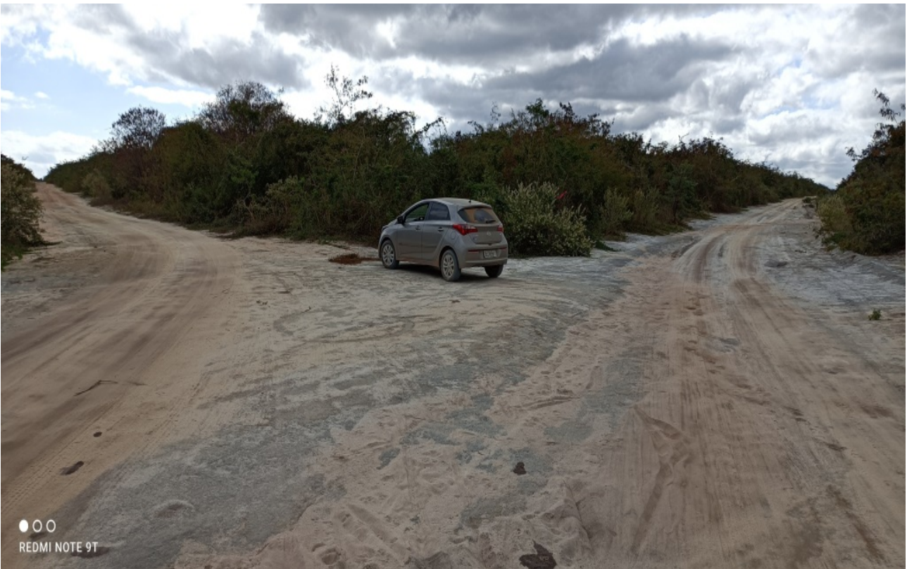
Figura 02: Vista geral da vegetação presente na Fazenda.