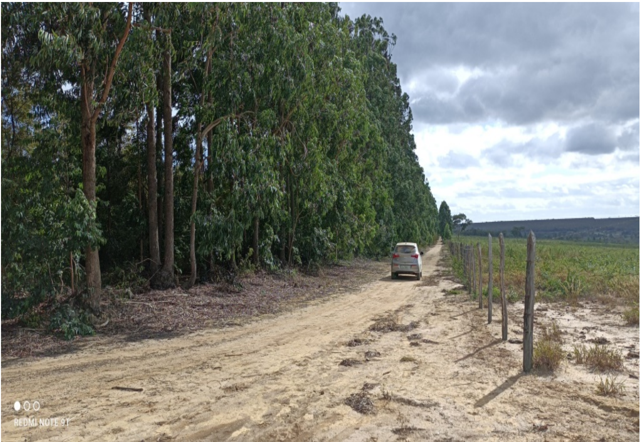
Figura 01: Vista geral do Plantio de Eucalipto da Fazenda.