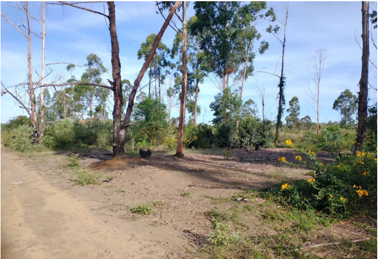
Figura 01: Vista geral da Fazenda.