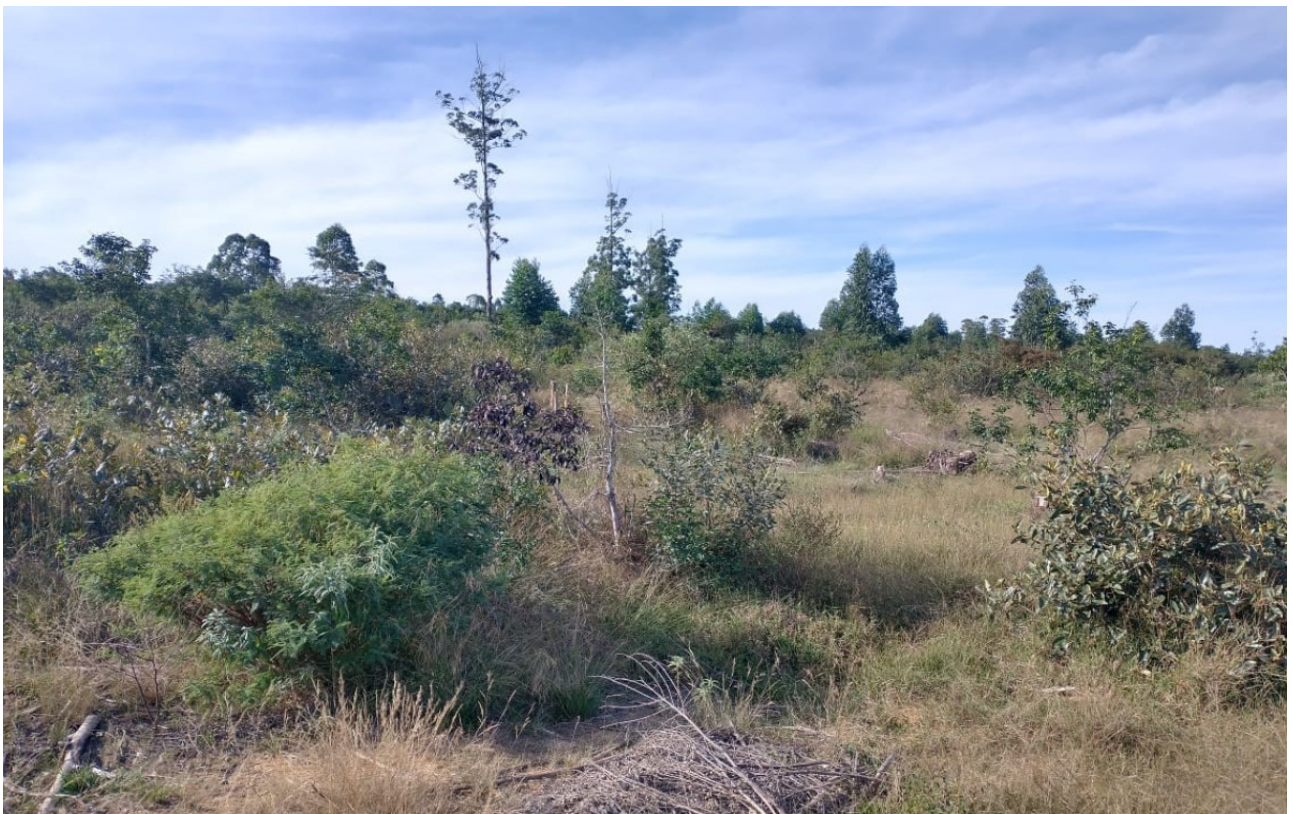
Figura 02: Vista geral da vegetação presente na Fazenda.