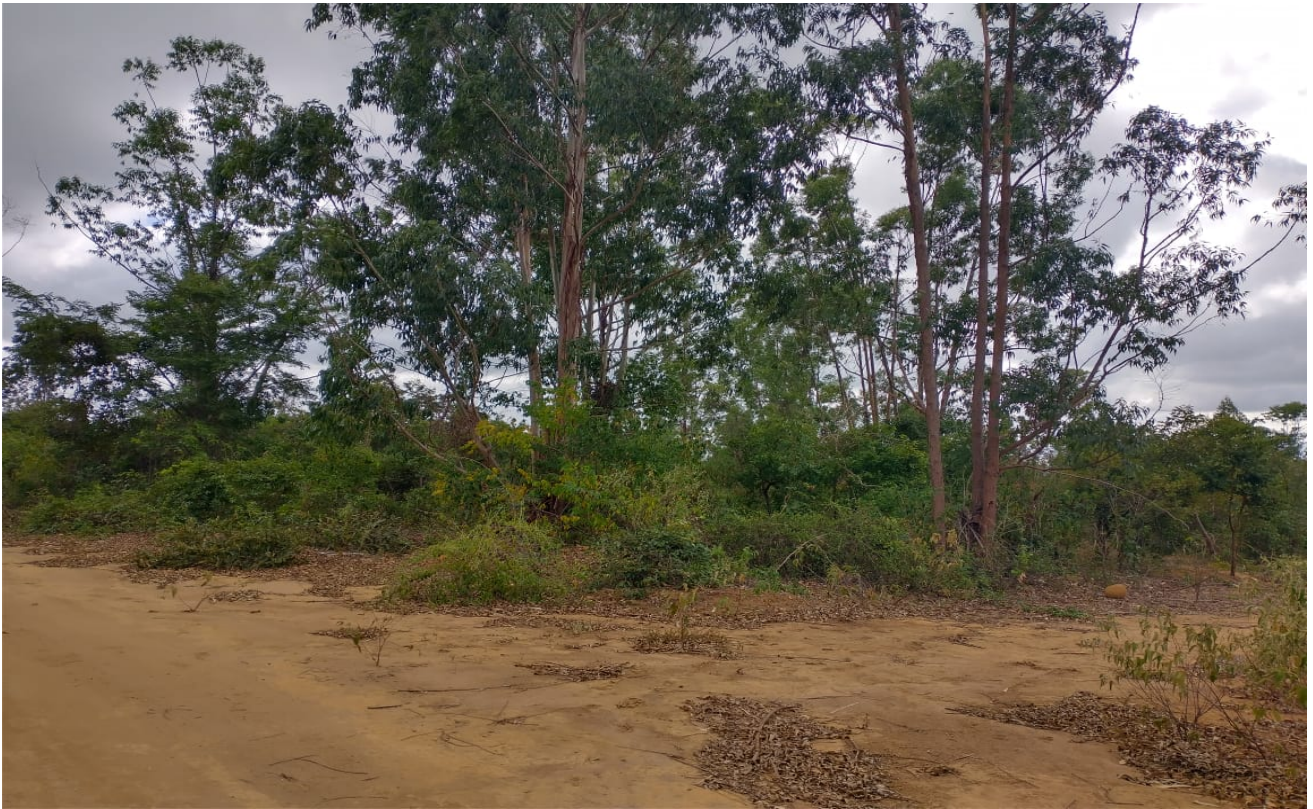
Figura 02: Vista geral da Floresta de Eucalipto – 2º Corte.