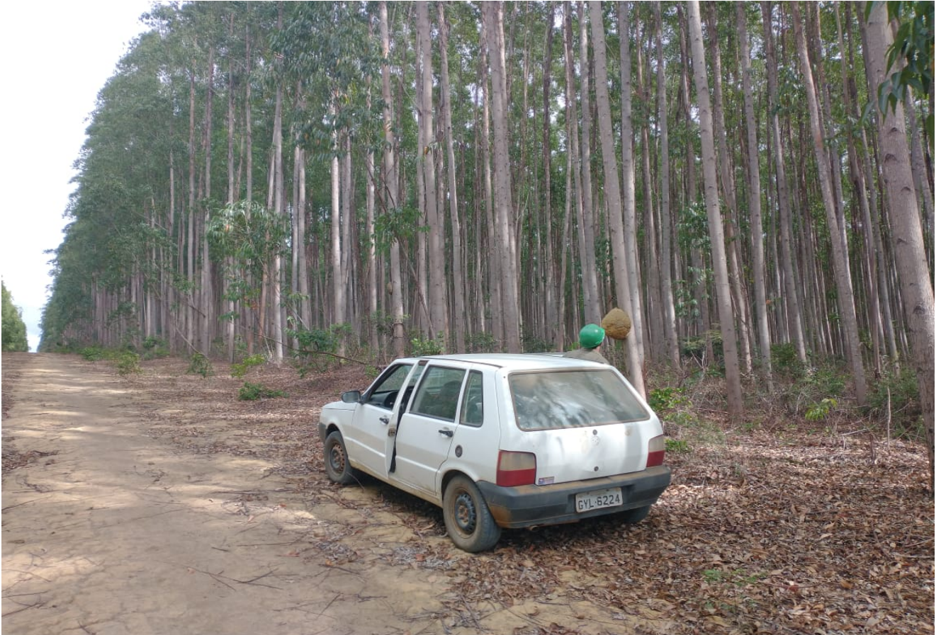
Figura 01: Vista geral da Floresta de Eucalipto – 1º Corte.