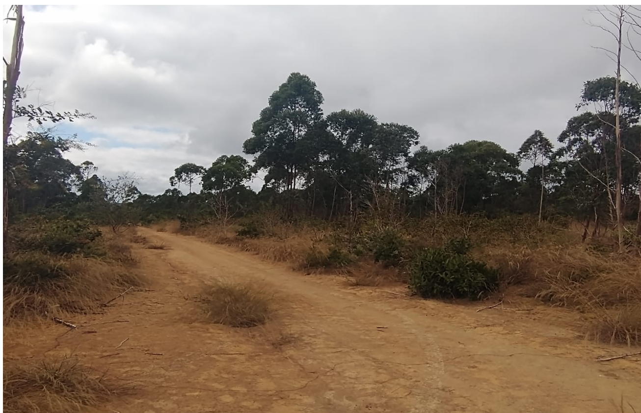
Figura 02: Vista geral 02 da Fazenda.