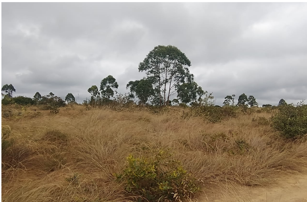
Figura 01: Vista geral 01 da Área da Fazenda.