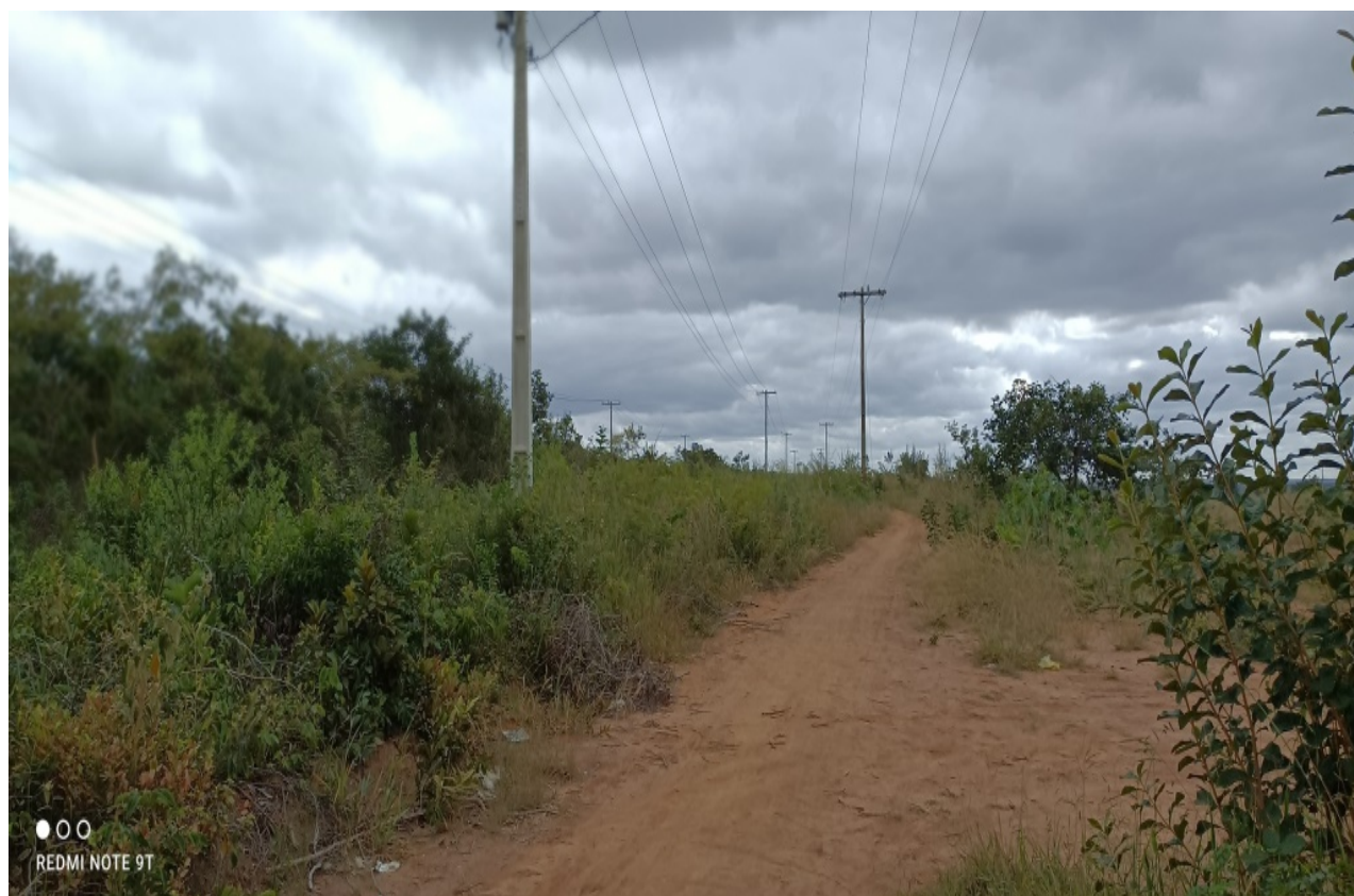
Figura 02: Vista geral da Estrutura De Iluminação Pública dentro da Fazenda.