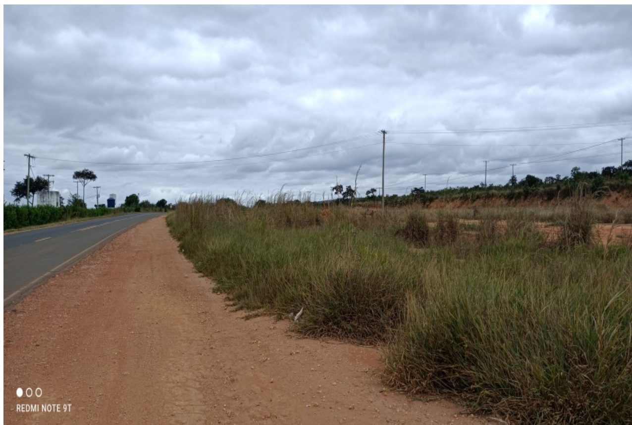
Figura 01: Vista geral da Área da Fazenda às Margens da Rodovia.