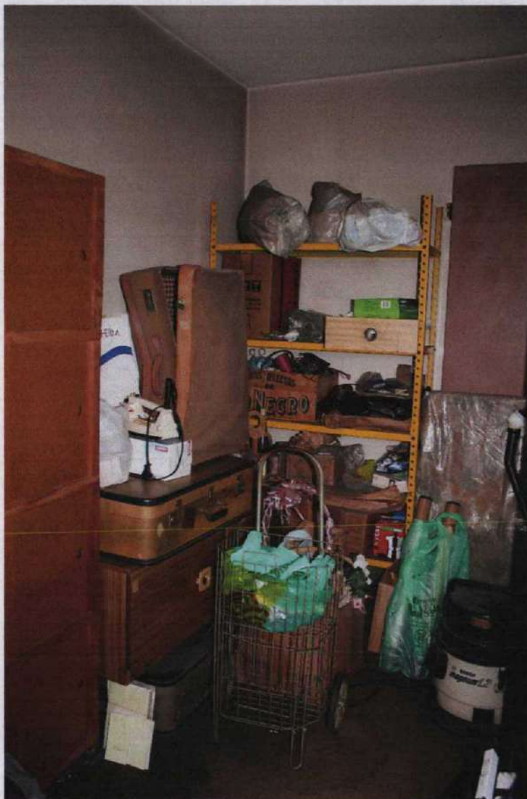
FOTO 16: Vista parcial do dormitório de serviço do imóvel avaliando.

ANTONIO GUILHERME MENEZES BRAGA ENGENHEIRO CIVIL - CREA 0601341350 ENGENHEIRO DE SEGURANÇA DO TRABALHO - REGISTRO 19.041 Avenida Conselheiro Nébias nº 688 cj. 92 – Tel/Fax: (13) 3221-4595 - Santos - SP Email : ag.braga@uol.com.br