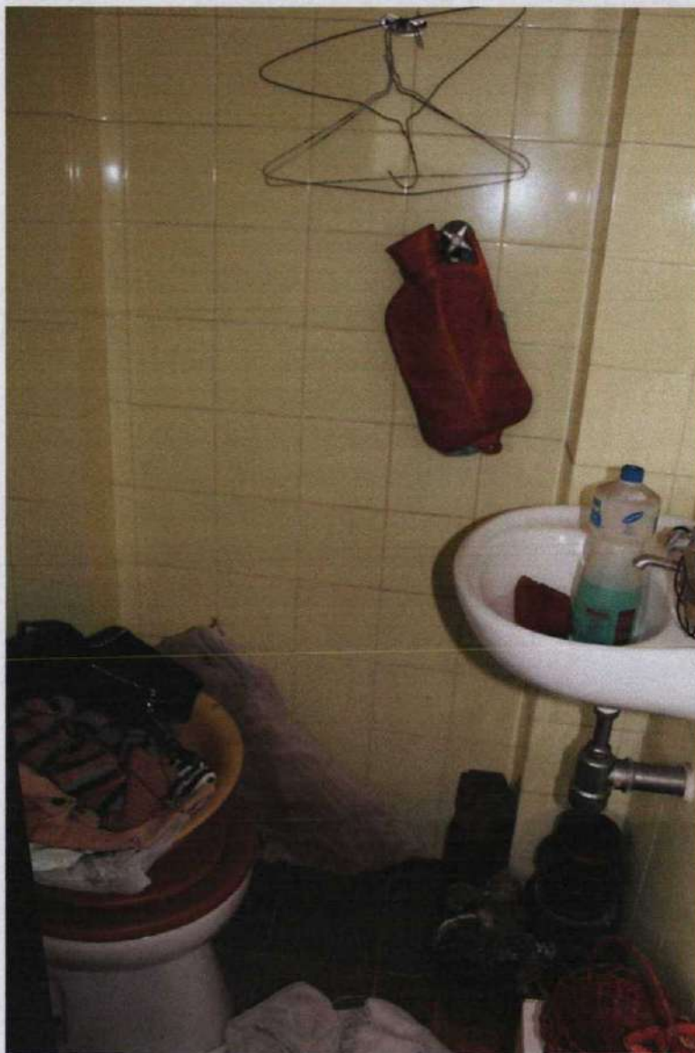
FOTO 17: Vista parcial do banheiro de serviço do imóvel avaliando.