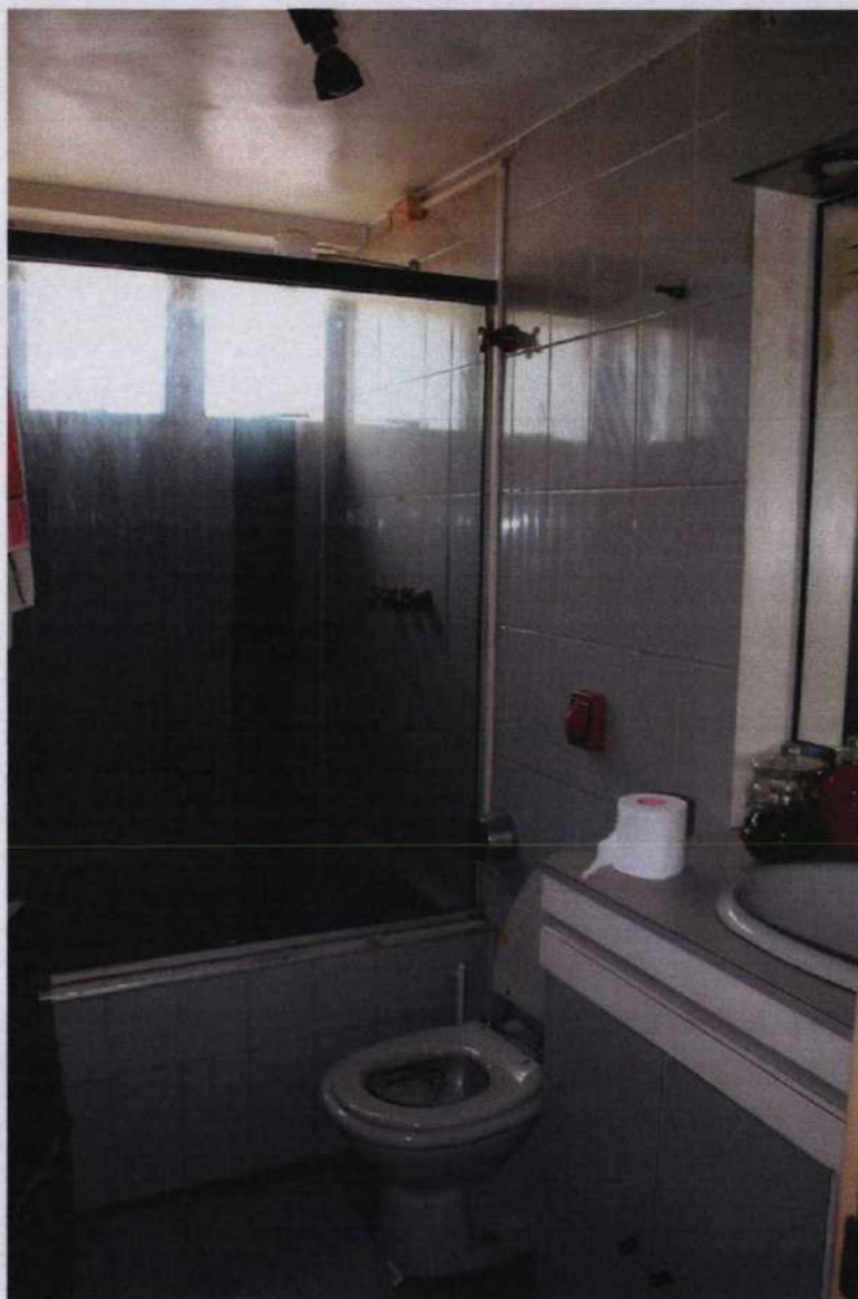
FOTO 8 Vista parcial do banheiro do imóvel avaliando.