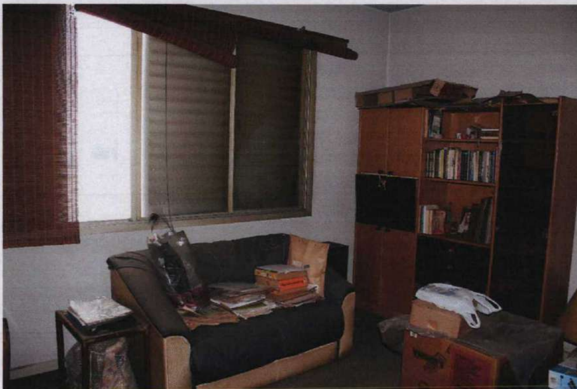
FOTO 12: Vista parcial do segundo dormitório do imóvel avaliando.

ANTONIO GUILHERME MENEZES BRAGA ENGENHEIRO CIVIL - CREA 0601341350 ENGENHEIRO DE SEGURANÇA DO TRABALHO - REGISTRO 19.041 Avenida Conselheiro Nébias nº 688 cj. 92 - Tel/Fax: (13) 3221-4595 - Santos - SP Email : ag.braga@uol.com.br