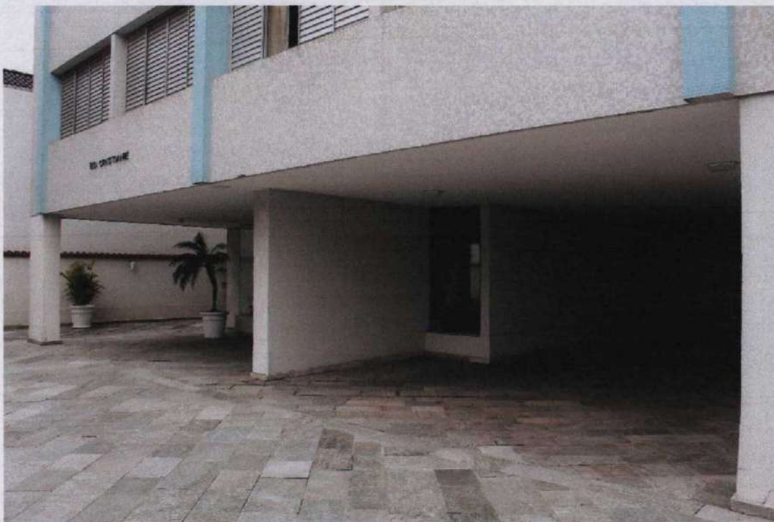
FOTO2: Vista parcial do interior do Condomínio Edifício Cristiane e Victor.