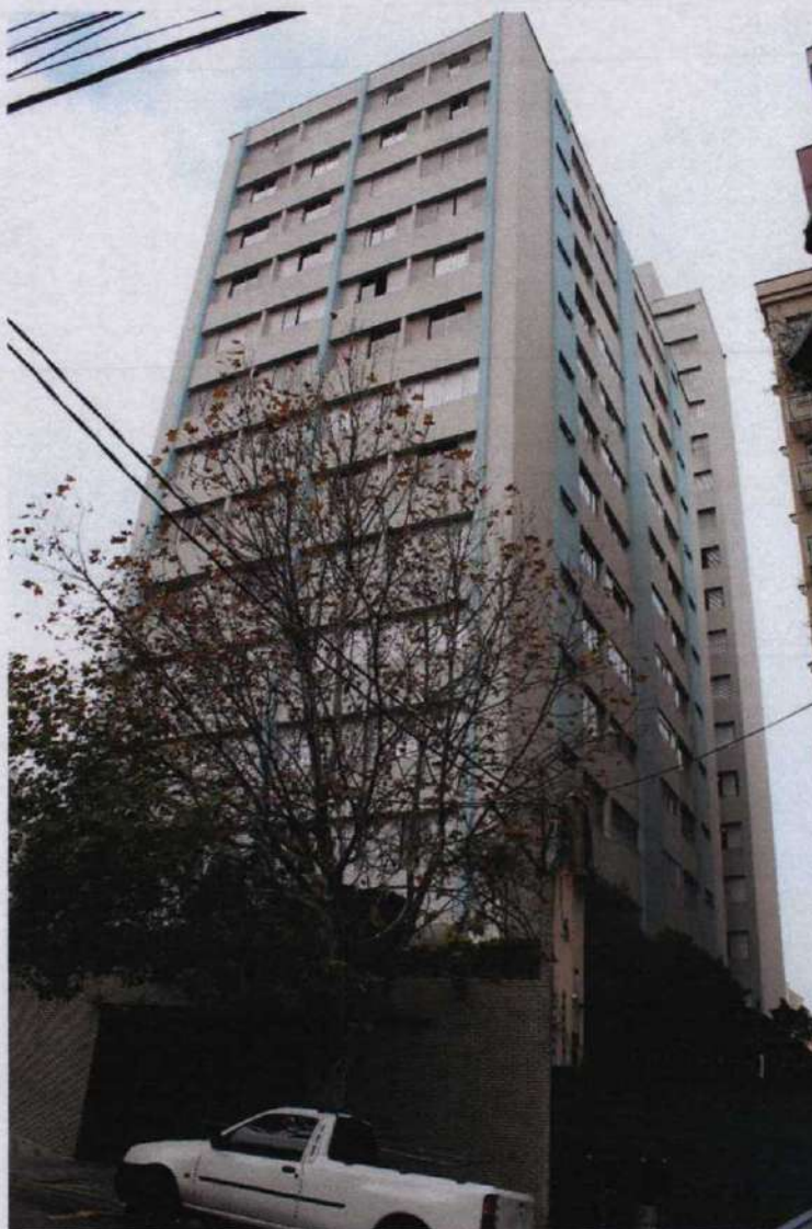
FOTO 1: Vista da fachada do Condomínio Edifício Cristiane e Victor.