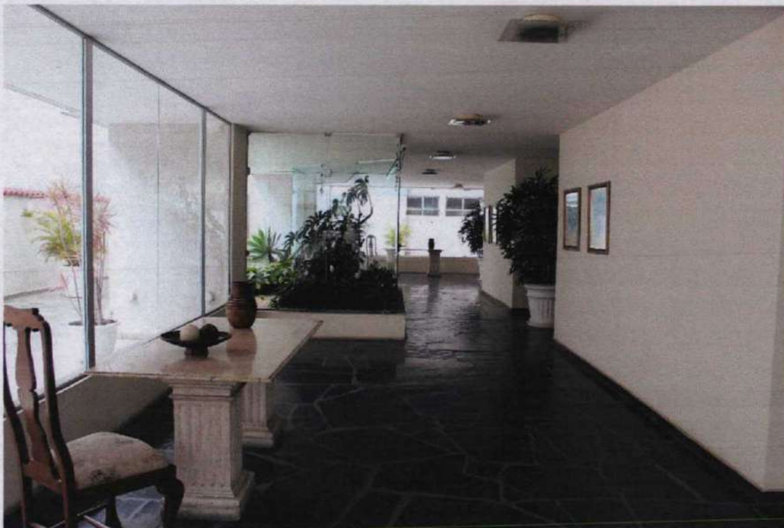
FOTO 3: Vista parcial do hall de entrada do Condomínio Edifício Cristiane e Victor.