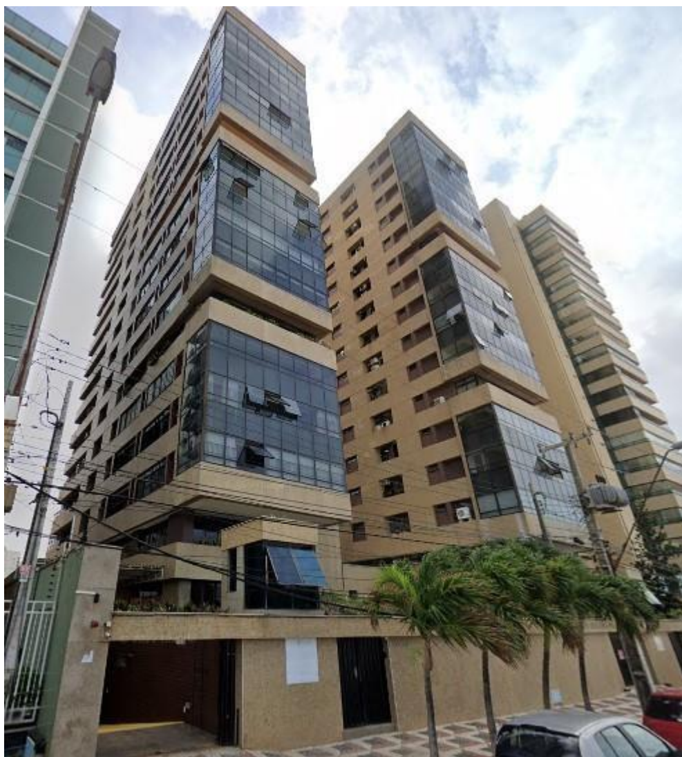
(Imagem do imóvel avaliado).